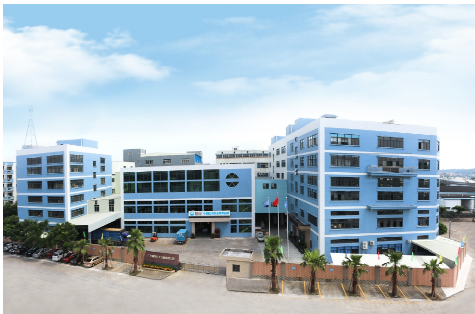
碧丽公司总部基地 The headquarters base of Bili Company